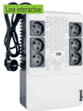
3 100 84

Onduleurs monophasés pour petits équipements : - en maison individuelle : télévision, ordinateur, box, switch, console de jeu... - en hôtel ou dans un petit magasin : petit réseau CCTV... - dans un bâtiment tertiaire/commerce : ordinateur/terminal point de vente, modem, téléphonie... Onduleurs composés de 6 prises 2P+T avec protection contre les surtensions : 4 prises secourues et 2 prises autonomes Fusible de protection intégré rapide à remplacer Chargeur USB - 1 A Possibilité de fixation murale Note : les valeurs d'autonomie sont estimées en minutes et peuvent varier en fonction des caractéristiques de la charge, des conditions d'utilisation et de l'environnement Livré avec packaging auto-vendeur