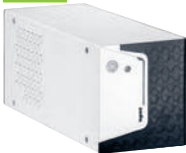
3 101 80

Onduleurs monophasés pour postes de travail, systèmes de sécurité, CCTV, terminaux de point de vente, applications domestiques... Protection contre les surtensions, les surcharges et les courts-circuits Gestion avancée en fonction du niveau de décharge de la batterie Auto-diagnostic et régulateur électronique de tension AVR intégrés Fonction de démarrage à froid Contrôle par microprocesseur Note : les valeurs d'autonomie sont estimées en minutes et peuvent varier en fonction des caractéristiques de la charge, des conditions d'utilisation et de l'environnement Livré dans packaging auto-vendeur